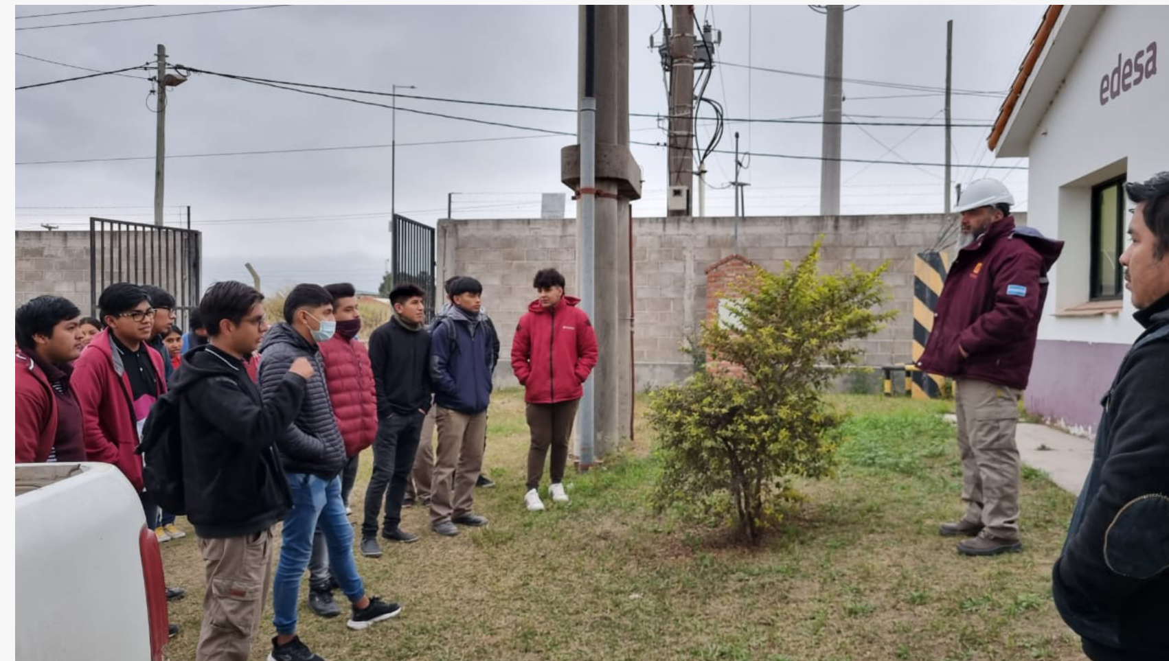
Visita ET Quijano