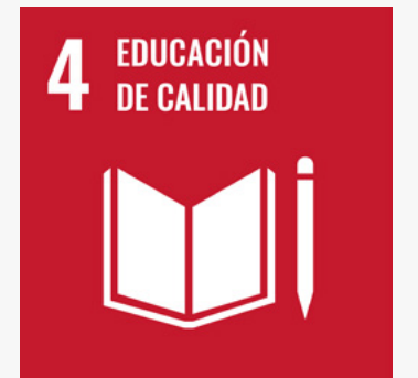
Indicadores GRI 404-2 y G4-DMA